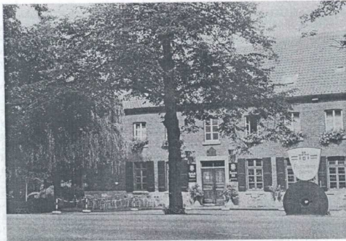
Lüttelforster Mühle 1973